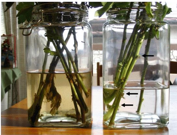
Fig. 3. Water in two vessels of Fig. 2 in the room with (right) and without (left) natural sound.

Difference of water in two vessels of Fig. 2 in the room with and without natural sound is shown in Fig. 3. The one with the natural sound shows clear water, and the quantity is decreasing. In addition, new sprouts are observed as indicated by arrows in Fig. 3. On the other hand, for chrysanthemum without the natural sound, water is a little muddy and consumption of water is not so much. Parts of stalks in the water begin to rot.