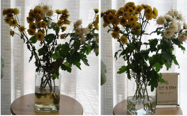
Fig. 2. 33 日経過後の菊の花. 右が自然音によるもの.

自然音のある室内とない室内で 33 日間経過後の二つの容器の菊の結果を Fig. 2 に示す。自然音のある室内の菊は比較的生き生きとしているのに対して、自然音のない室内の菊は、葉が一部枯れている。