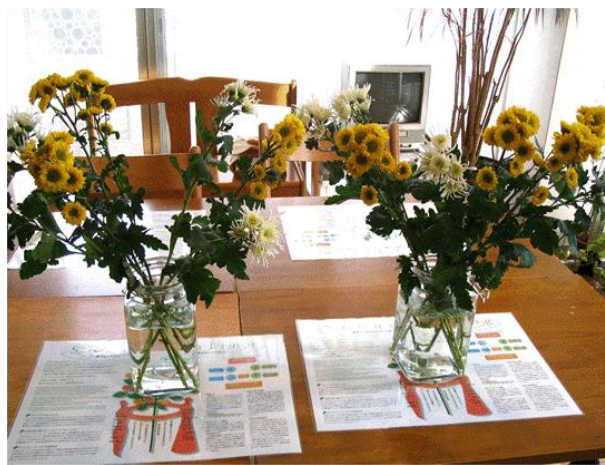
Fig. 1. Chrysanthemum at the start of experiment.

These two sets of chrysanthemum were set in two rooms with same area (13.2m 2 ) under the same conditions of lighting, temperature and moisture. Natural sound of little streams recorded in Yakushima (CD: Healing Island 'Yakushima' by Satoru Nakata, PICW-1020) was put on only in one room. A CD player (aiwaCSD-A100) was used in the experiment.