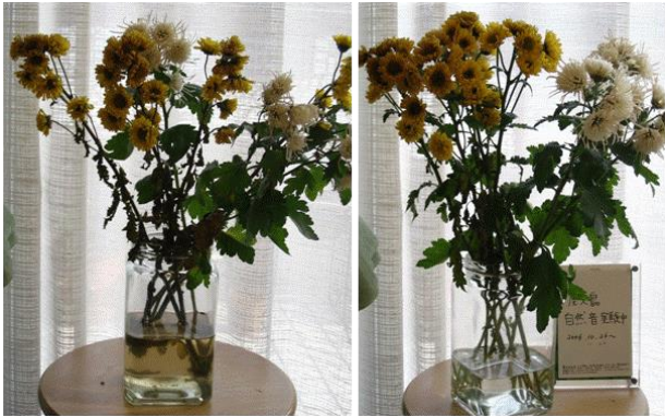
Fig. 2. Two set of chrysanthemum after 33 days in the room with (right) and without (left) natural sound.