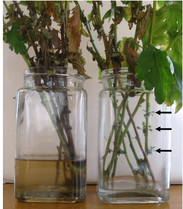
Fig. 4. Two set of chrysanthemum after 48 days in the room with (right) and without (left) natural sound.

Figure 4 shows two set of chrysanthemum in two different rooms after 48 days passed. More leaves are dead for the chrysanthemum in the room without the natural sound (left), and consumption of water is little. Fairly parts of stalks in the water are rotting. The chrysanthemum in the room with natural sound (right) has green leaves and more consumption of water as shown in Fig. 5, and the water is clear. In addition, new sprouts begin to grow as indicated by arrows in Fig. 4, which indicates the preservation of life force.